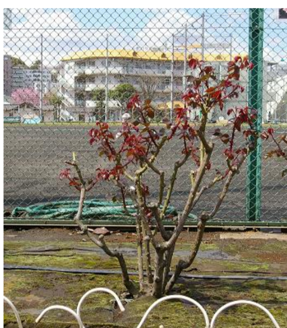
3月：赤い葉が出てきます。