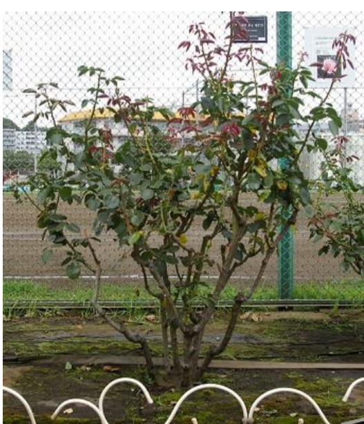
7月：養分を蓄え秋の開花の準備をします。