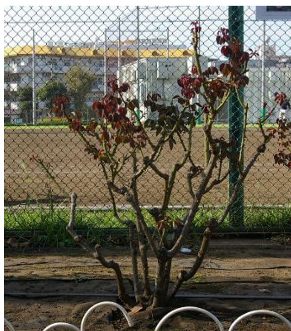
10月：赤い葉は光合成は出来ません。