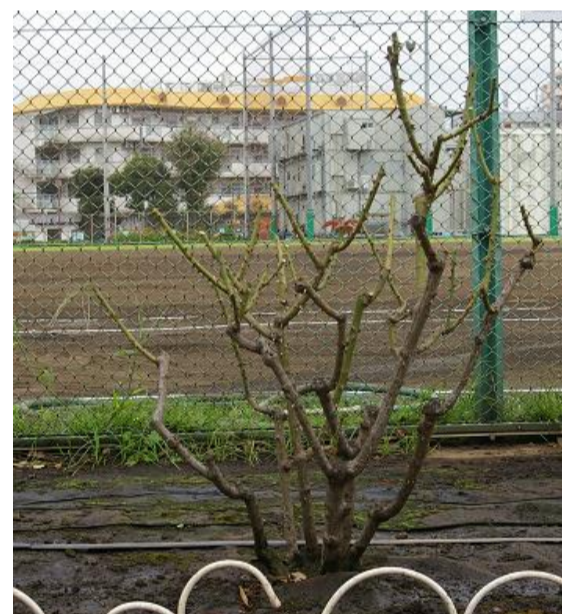
9月：秋の剪定をします。