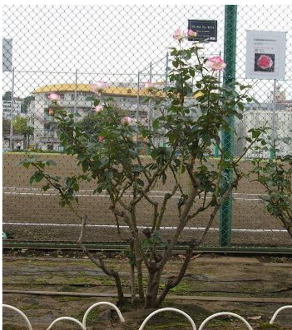
11月：光合成の養分で開花の準備をします。