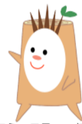
緑とコミュニティーグループ 公式キャラクター 『きりかぶくん』