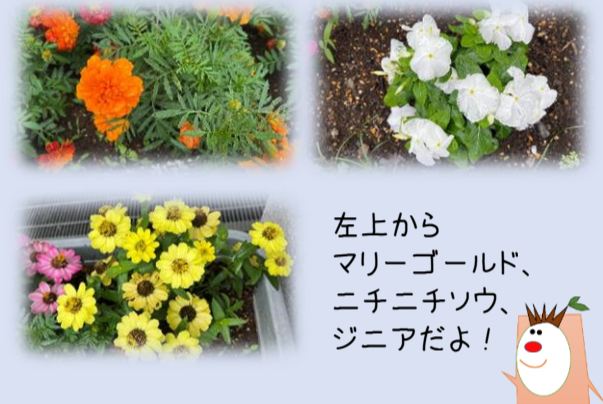
左上から マリーゴールド、 ニチニチソウ、 ジニアだよ！

GREEN×EXPOの文字の周りには当団体のキャラクターきりかぶくんとかぶみちゃんも設置し、より親しみやすい花壇になったのではないのでしょうか？引き続き花壇お世話隊も継続して行っています。フォトジェニックな特設花壇と一緒に写真をとってみたいと思います。2027年の開催時期が近づくにつれてこの特設花壇をパワーアップさせていきたいと思っています。もちろん、他の園内の花壇も今まで以上に素敵な花壇にしていきますので皆様、お楽しみに♪植え付けイベントや花壇お世話隊にも積極的なご参加お待ちしております。