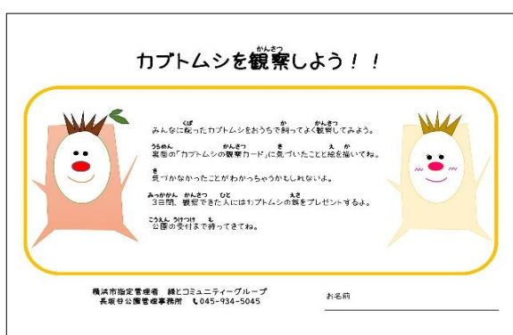
カブトムシの観察カード

イベントの最後には、参加者の皆さんに長坂谷公園で採れたカブトムシをプレゼントしました。カブトムシを育ててくれる子には「カブトムシ観察カード」を配布し3日間カブトムシの様子を観察してもらいます。観察日記が描けたお友達には昆虫ゼリーをプレゼントしました。この「カブトムシ観察カード」は今年初めての試みでしたが上手に観察カードを描いてくれました。カブトムシはオスとメスでプレゼントしたのでうまく繁殖すれば来年も元気にカブトムシが育てられるはずです。その際には、ぜひ公園に遊びに来て報告してくれると嬉しいです♪