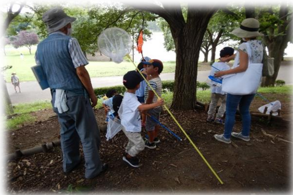
昆虫観察会の様子

そして、園内で昆虫を観察した後には、レストハウスでセミの抜け殻当てクイズを行いました。セミの抜け殻をみてセミの種類を当てるといった難易度高めなクイズでしたが参加者の皆さんは一生懸命セミの抜け殻を観察して見分け方をマスターしていました。