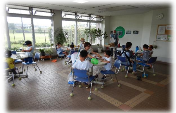
セミの抜け殻当てクイズ

イベントの最後には、参加者の皆さんに長坂谷公園で採れたカブトムシをプレゼントしました。カブトムシを育ててくれる子には「カブトムシ観察カード」を配布し3日間カブトムシの様子を観察してもらいます。観察日記が描けたお友達には昆虫ゼリーをプレゼントしました。この「カブトムシ観察カード」は今年初めての試みでしたが上手に観察カードを描いてくれました。カブトムシはオスとメスでプレゼントしたのでうまく繁殖すれば来年も元気にカブトムシが育てられるはずです。その際には、ぜひ公園に遊びに来て報告してくれると嬉しいです♪