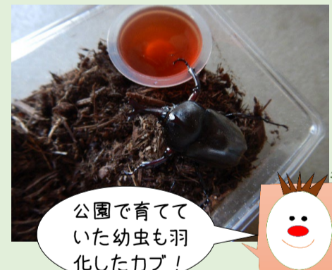
公園で育てていた幼虫も羽化したカブ!