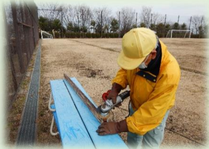
カップブラシでの塗装はがし