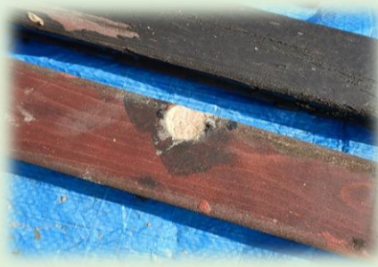
パテを使った補修

毎年、冬場の作業としてベンチの塗装を行っています。ベンチの材は様々ですが、ひのきなどの木材です。最近ではプラ擬木のベンチなどもありますが、長坂谷公園の屋外にあるベンチは木材で、どうしても雨などの影響で劣化が進んでしまいます。そこで、毎年塗装をすることで少しでもベンチの材を長持ちさせる「ベンチの長寿命化」を行っています。まずはベンチの取り外し作業からはじまります。小さい隙間にうまくボルトが通っているベンチやネジ山が壊れてしまっているボルト、ボルト自体がサビて回らないなんてものもあるので一苦労の作業です。どうにかベンチ板の取り外しが終わるとケレンやカップブラシを使用して、塗装を剥がし、その後ベンチ板のチェックを行います。傷んでいる箇所はパテなどを使用し補修、板の交換をしていきます。その後、再度塗装を行い、ベンチを元の状態へと組み上げていきます。板の順番が同じでないとビスの穴が合わなかったりと苦労することがあります。このような手順でベンチが長寿命化されていきます。長坂谷公園には多くのベンチ、テーブル、スツール等があります。中々、1シーズンでは塗り切れない箇所も出てきますが徐々に長寿命化を継続していきますので長い目で見ていただくと幸いです。