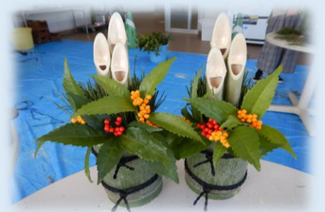
完成したミニ門松