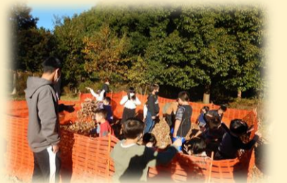
落ち葉プールの様子