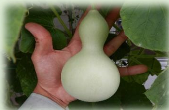
手のひらくらいの大きになりました！

前回の汗かき通信で紹介したひょうたんのグリーンカーテンに実ができました。今年は例年に比べ大きく育っていますが数が少ないです。量より質の年のようですので大切に大きく育てていきたいと思っています。