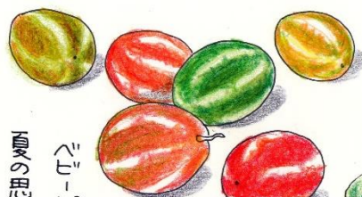
オキナワ スズメウリ