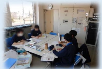
実際に書いてもらったポスターを紹介するカブ!