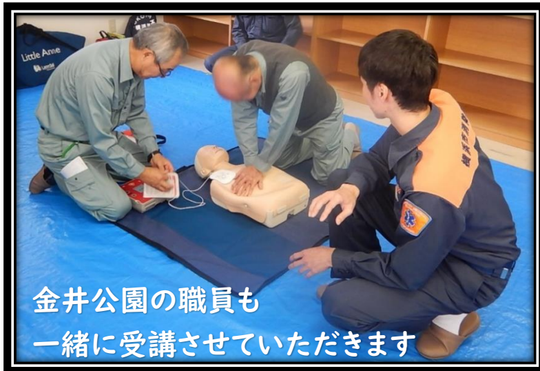
金井公園の職員も 一緒に受講させていただきます

テキストや映像を見ながら、救命の流れを確認します。 また、実際に人形を使いAEDの使い方などを勉強します。