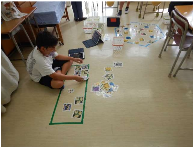
苗を育てている間に、植え付けのデザインも検討してくれました。