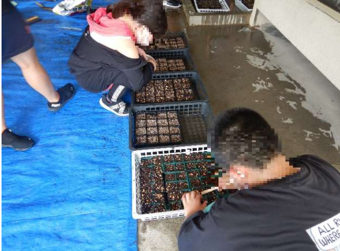
9月初旬、苗づくり用のトレーに種を植え付けました。

園内には3か所の花壇と大中小17基のプランターがあり、ここに400ポット以上の花苗を植え付けることにより、年中花が咲くメルヘンな園地を演出しています。今期分からは、この花苗づくりを東俣野小学校の児童が手伝ってくれることになりました。