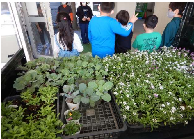
いよいよ公園に向けて育てた花苗を運び込みます。児童たちはトラックに積み込んだ後、公園を訪れて植え込みも行ってくれました。

園内の花壇やプランターに植わっている花苗は、年内にもう少し成長するとともに花を咲かせ続けてくれます。5月の節句ころまで楽しめるので、利用者の皆さんも大切に見守ってください。