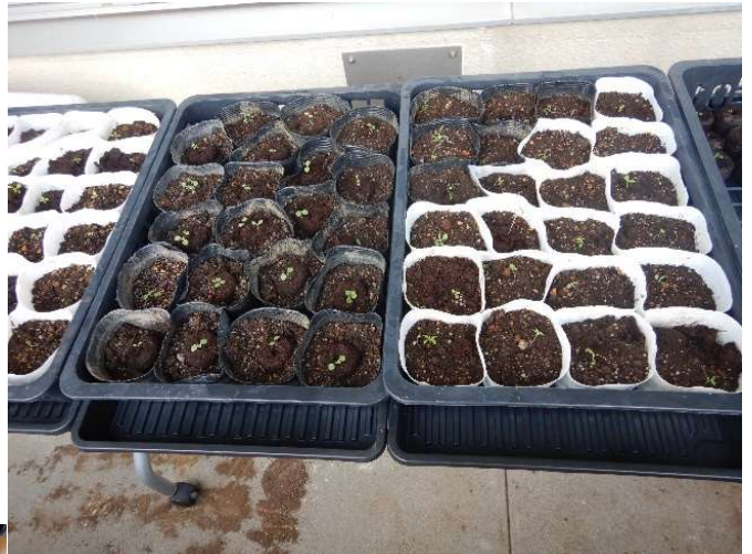
9月中旬には、発芽した苗をポットに移植しました。